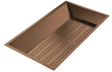
Vaschetta forata inox PVD Copper 8151 008 * solo in abbinamento con l'accessorio 8644 101