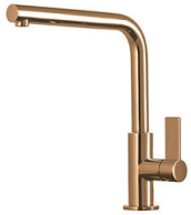
Miscelatore Omega Copper 8497 400